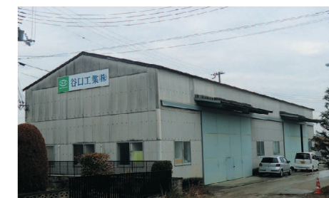
小野工場(兵庫県小野市)