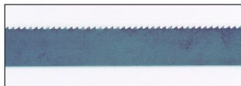
従来のシングルピッチ