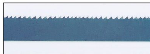
ミラクルソーのVLピッチ